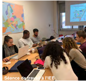
Séance de travail à l'IEE