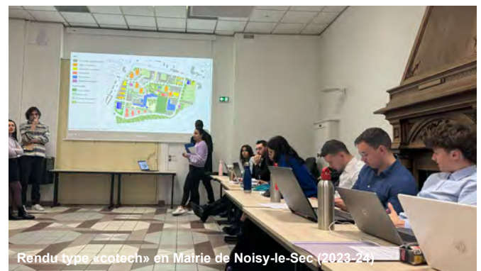
Rendu type «cotech» en Mairie de Noisy-le-Sec (2023-24)