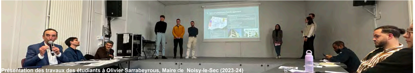
Présentation des travaux des étudiants à Olivier Sarrebeyrous, Maire de Noisy-le-Sec (2023-24)

Partenariats avec des acteurs au cœur des mutations urbaines contemporaines : Plaine Commune : étude sur le Canal St Denis, Commune de Noisy-le-Sec : atelier sur le projet de renouvellement urbain, Citydev.brussels : étude de la mise en œuvre d'un projet de renouvellement urbain à Bruxelles