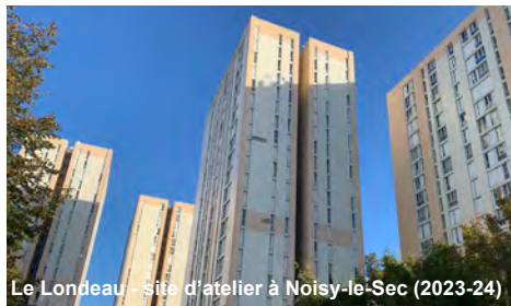
Le Londeau - site d'atelier à Noisy-le-Sec (2023-24)