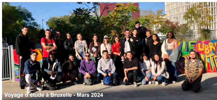
Voyage d'étude à Bruxelles - Mars 2024