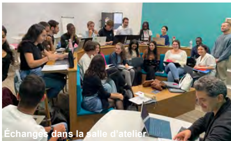
Échanges dans la salle d'atelier