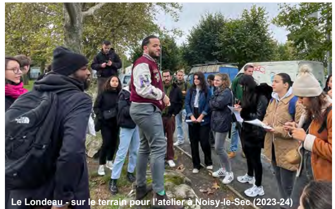
Le Londeau - sur le terrain pour l'atelier à Noisy-le-Sec (2023-24)