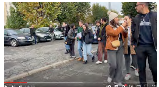
Lien vers la vidéo de présentation de l'atelier 2023-2024 : https://youtu.be/Hq2Fwfrdfs