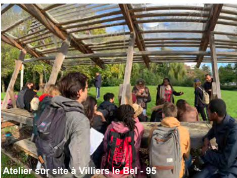
Atelier sur site à Villiers le Bel - 95