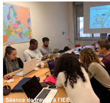
Séance de travail à l'IEE