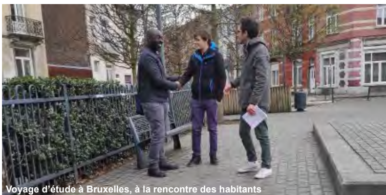
Voyage d'étude à Bruxelles, à la rencontre des habitants