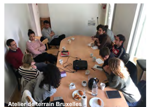
Atelier de terrain Bruxelles