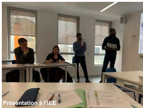
Présentation à l'IEE