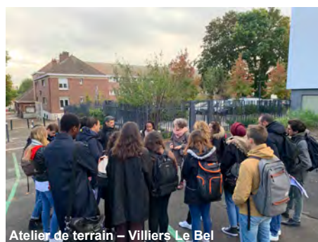
Atelier de terrain – Villiers Le Bel