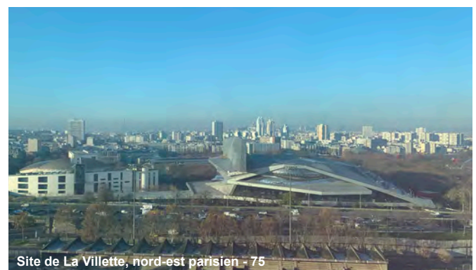
Site de La Villette, nord-est parisien - 75