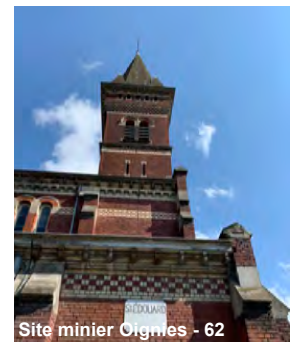
Site minier Oigmes - 62