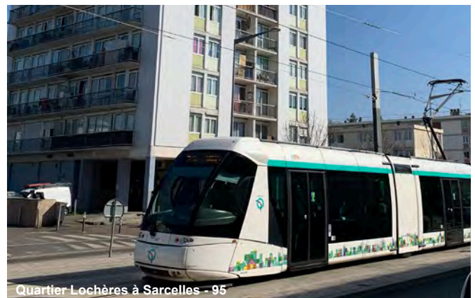
Quartier Lochères à Sarcelles - 95