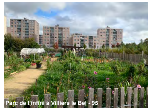
Parc de l'infini à Villiers le Bel - 95