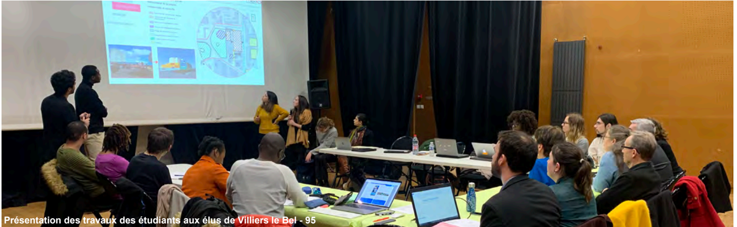
Présentation des travaux des étudiants aux élus de Villiers le Bel - 95